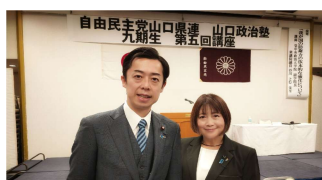
12月17日 自由民主党山口県連政治塾