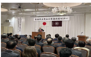
10月30日 自民政経セミナー