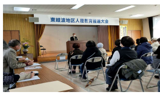
12月4日 東岐波地区人権教育推進大会